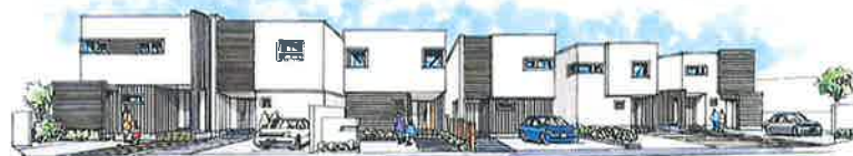
コンセプトイメージハウスです。実際と異なる箇所があります。