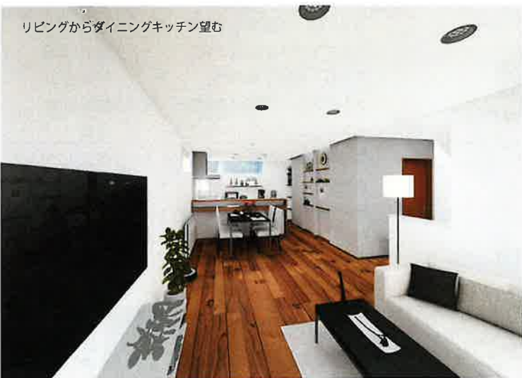
リビングからダイニングキッチン望む