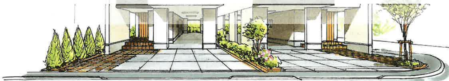
イメージバースです。若干異なる箇所がございます。