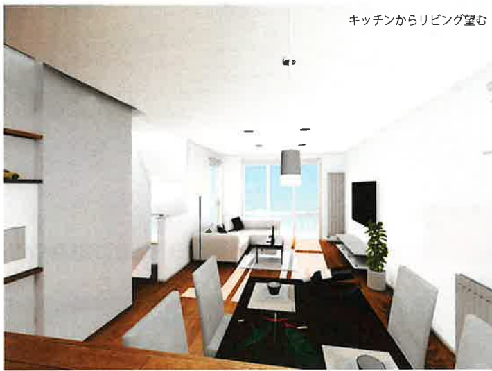
キッチンからリビング望む