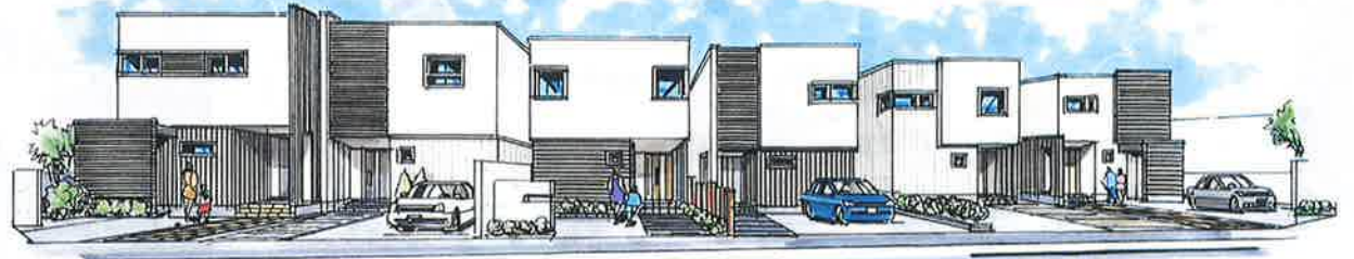
ハースはイメージです。実際と異なる場合があります。